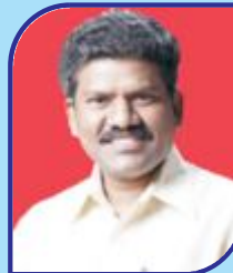
Alle Satyanarayana Committee Member