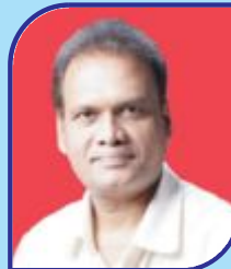
Badugu Vishwanath Committee Member