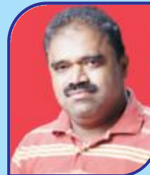
Talla Naresh Committee Member