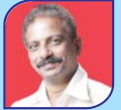
Ekkaldevi Kailash Committee Member