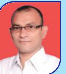
Vemula Manohar Committee Member