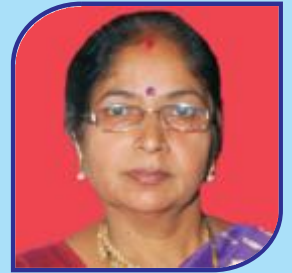
Yatham Latha Committee Member