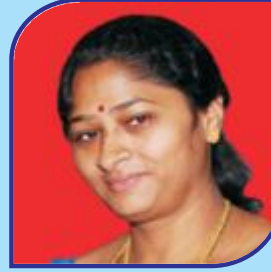
Bhoga Jyotilaxmi Committee Member