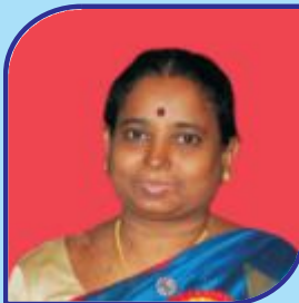
E. Vijayalaxmi Co. Opted Member