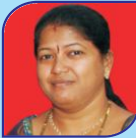
Pillamarapu Padma Committee Member